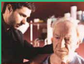
15 de mayo En la ciudad sin límites (2002). Antonio Hernández