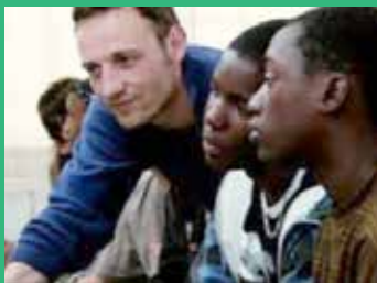
22 de mayo La clase (2008). Laurent Cantet