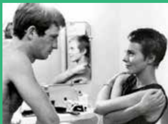
24 de abril Al final de la escapada (1960). Jean-Luc Godard .