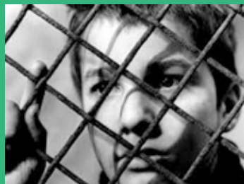
10 de abril Los 400 golpes (1959). François Truffaut